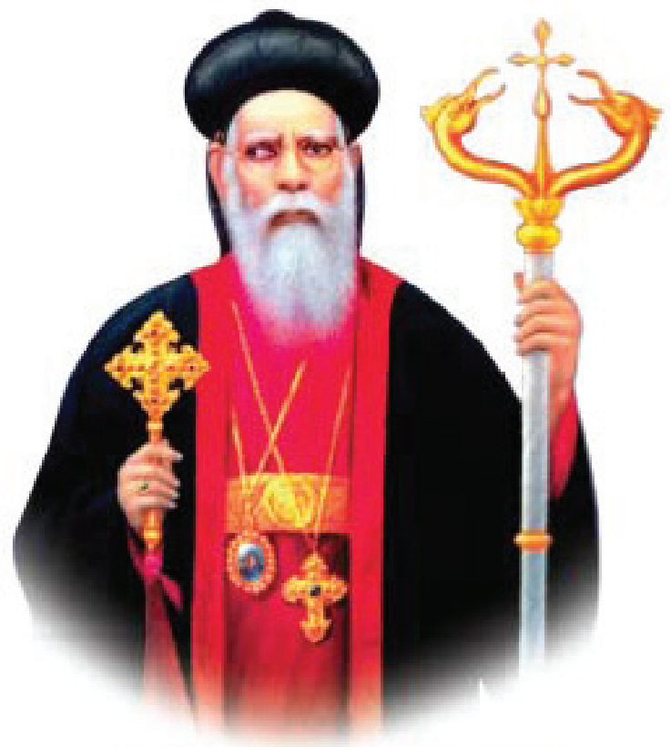
St. Dionysius Vattasseril (Malankara Sabhaa Bhaasuran)