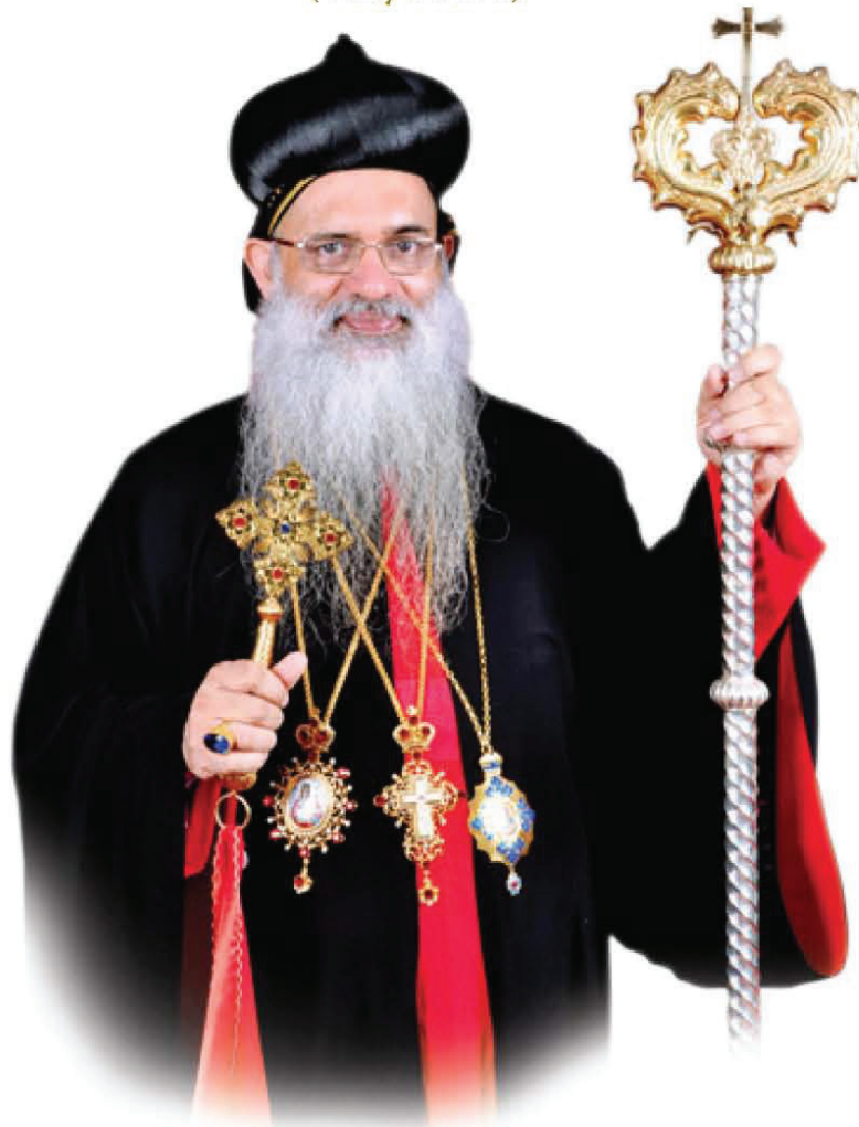
His Holiness Baselios Marthoma Paulose II (Catholicose of the East & Malankara Metropolitan)