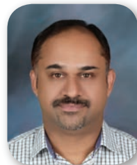
Dooby Das St. Stephen A