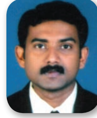
Deep John St. Elias