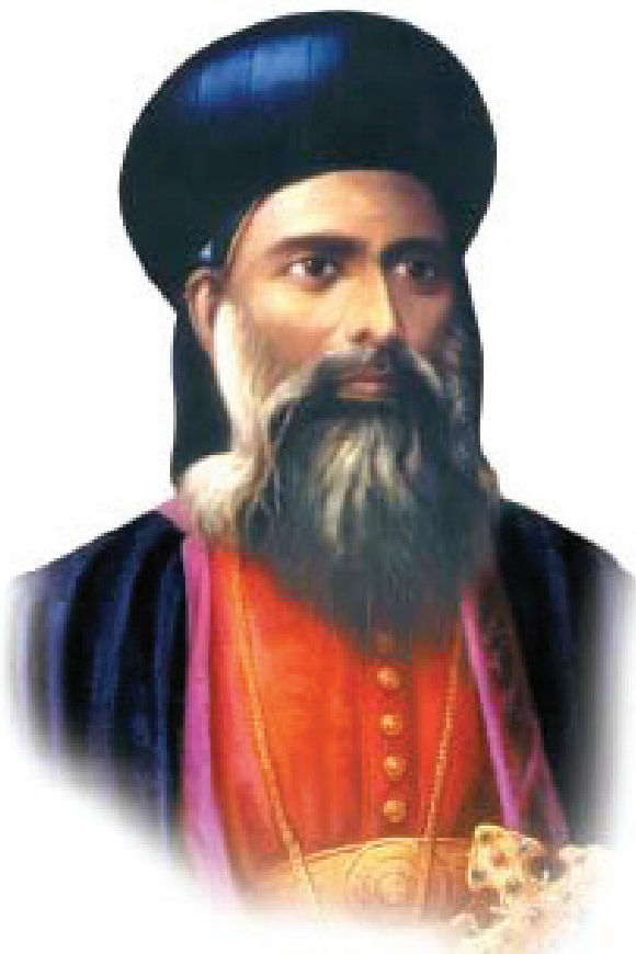
St. Gregorios of Parumala Our Patron Saint