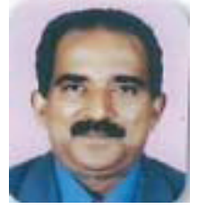
Babu Varghese St.Dionysius