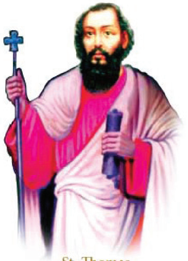
St. Thomas Apostle of India and the East