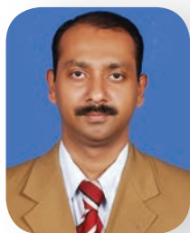
Tinkumon Joys St. Behanans