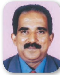
Babu Varghese St. Dionysius