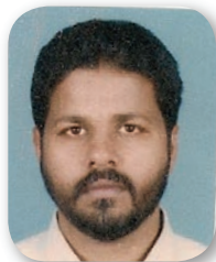
Boban Eapen St. Barsouma (Bachelors' Prayer)