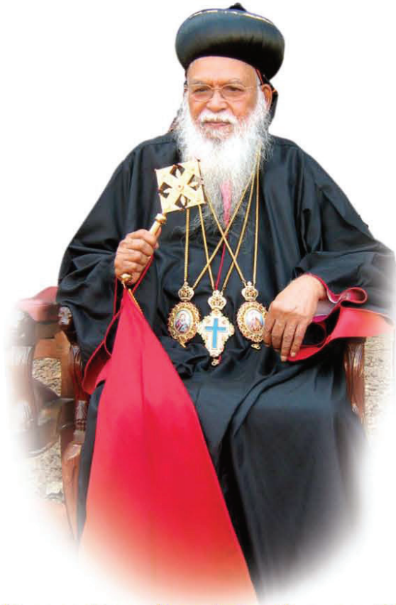
His Holiness Baselios Marthoma Didymus I Seventh Catholicose of the East in Malankara (Valiya Bava)