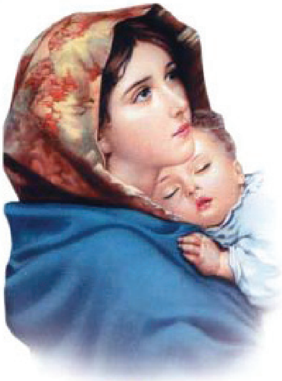
St. Mary The Mother of God