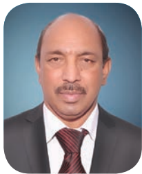
Thomas Thomas St. Behananas